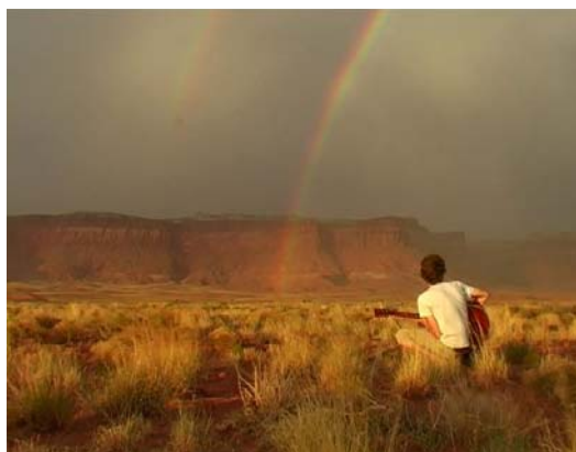
I'll be lost when I find you , 2006 DVD, 12" Ed. 5