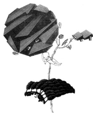
Tropa que la boca está arriba , 2005

Tinta pigmentada y tinta china sobre papel. 109 x 230 cm.