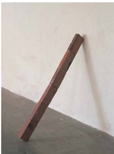
Line , 2005 6 Ladrillos, Ed. 3 Medidas variables

JAIME PITARCH (Barcelona, 1963). Presentará una selección de sus obras más recientes. Entre otras, "Close Encounters"; en la que un carrousel de diapositivas proyecta una secuencia de 80 imágenes de dos sillas que se acoplan en diferentes posiciones.. También presentará una pieza inédita de su serie Momentum , y la fotografía "Before the fall". Pitarch se formó en Londres (M.A. Pintura, Royal College of Art, Londres; B.A. Pintura Chelsea College of Art, Londres; 1990-93). En sus obras utiliza fotografía, video, escultura, dibujo o instalación. En los últimos años cierta obsesión con el orden, no como sistema de clasificación, sino como síntoma del deseo de controlar la realidad, ha sido una constante en su trabajo. Pitarch explora la posibilidad de atar el orden de las "cosas físicas" con otros órdenes más abstractos (políticos, económicos, etc.) y sus instalaciones-objetos revisan el modo en que esas "cosas físicas" pueden ser ecos de una realidad que no "encaja" y que nos desorienta/desconcentra.