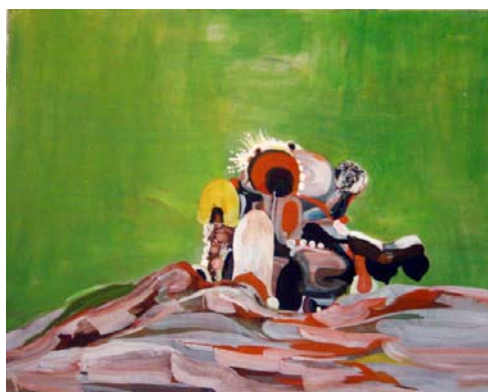
La navaja suiza , 2006 Oleo sobre lienzo. 127 x 153 cm.

MIQUEL MONT (Barcelona, 1963). La obra de Miquel Mont transmite su preocupación por la pureza de la pintura, por objetivar su "hacer" y su materialidad. Sus series se plantean en torno a una proposición dada que determina el tipo de soporte, la forma de aplicar la pintura, el concepto, el objeto y la imagen a desarrollar en el conjunto de piezas. En esta edición de ARCO, Miquel Mont presenta obras de su nueva serie Flicker , piezas en las que la pintura parece arrancada del soporte y que aluden al lenguaje cinematográfico (las líneas de los fotogramas y el parpadeo de las luces). En 2006 fue seleccionado para la muestra "La force de l'art" presentado en el Grand Palais y que formaba parte de la triennial de Paris.