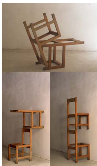
Close Encounters , 2006 Proyector + 80 diapositivas 5' Ed 2/5