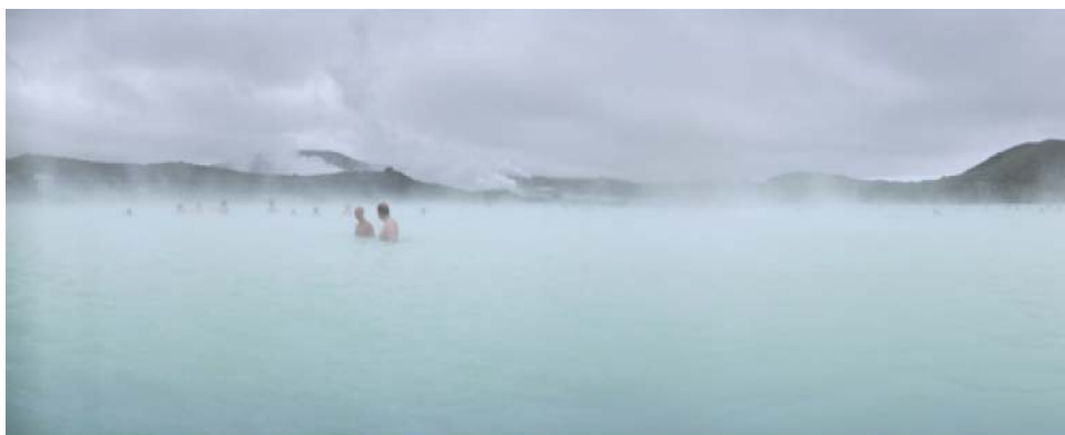
En la nada II , 2007 Fotografía en papel montada en metacrilato con marco de acero. 104 x 254 cm.

MAYTE VIETA (Blanes, 1971). Presentará las fotografías más recientes de su serie "En la nada". Paisajes atemporales, soñados, que siguen en la línea de expresar un mundo de sentimientos, un universo de fuerte carga poética. Sus fotografías hacen referencia a lo visible, a la corporeidad de la luz ante un espacio inabarcable y atemporal. Entre sus exposiciones individuales destacan: "La fragilitat del mon. Cendres" Tinglado 2, Tarragona; "Corredores de Luz" MUA, 2002; "Sin Fin" Fundació Vila Casas, 2004. También ha participado en la muestra colectiva "Miradas de Mujer" en el Museo Esteban Vicente, Segovia, 2005 y "Entornos de la Colección" Centro de Arte Caja de Burgos.