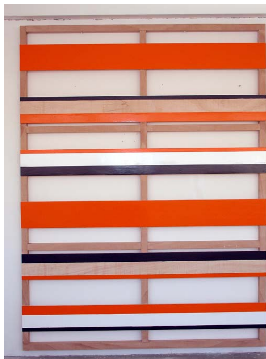
Flicker VIII , 2007 Acrílico y esmalte. 250 X 190 X 7 cm.

MIQUEL MONT (Barcelona, 1963). La obra de Miquel Mont transmite su preocupación por la pureza de la pintura, por objetivar su "hacer" y su materialidad. Sus series se plantean en torno a una proposición dada que determina el tipo de soporte, la forma de aplicar la pintura, el concepto, el objeto y la imagen a desarrollar en el conjunto de piezas. En esta edición de ARCO, Miquel Mont presenta obras de su nueva serie Flicker , piezas en las que la pintura parece arrancada del soporte y que aluden al lenguaje cinematográfico (las líneas de los fotogramas y el parpadeo de las luces). En 2006 fue seleccionado para la muestra "La force de l'art" presentado en el Grand Palais y que formaba parte de la triennial de Paris.