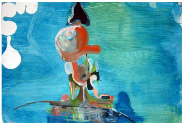
S/T , 2001 Técnica mixta sobre papel. 129,5 x 202,5 cm.

SANTI MOIX (Barcelona, 1960) Presenta su último trabajo pictórico sobre lienzo y sobre papel que muestran la fascinación del artista por los temas de la acumulación y el movimiento. Un universo expresivo pictórico que conecta con las mismas inquietudes y formas volumétricas que contienen sus esculturas y cerámicas. Cada una de sus obras, carga con la tensión de historias acumuladas que en sus pinturas más recientes se hacen más figurativas. Santi Moix vive y trabaja en Nueva York, donde en enero de 2007 ha tenido su última individual en la galería Paul Kasmin.. En el 2002 Moix fue galardonado con el Guggenheim Fellowship Award . En la Caixa de Girona ha presentado en el 2005 la exposición individual "De dins a fora". En el 2007 el Museo Nacional de La Cerámica acoge una muestra individual que además de sus cerámicas también incluirá pinturas y dibujos recientes.