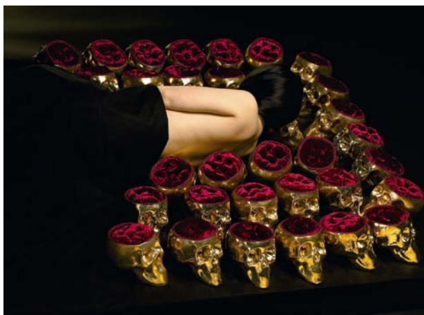
El lecho , 2006 Luxachrome. 125 x 91 cm. Ed. 10