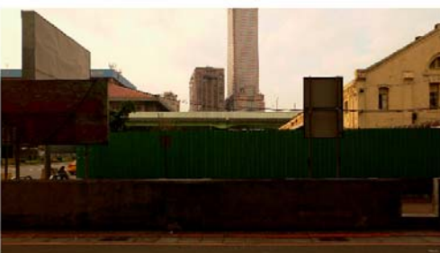
Serie PURE , 2006 Fotografía. 33 x 55 cm.

RICHARD T. WALKER (Shropshire, UK, 1977) vive y trabaja en Londres. Presenta su pieza " I'll be lost when I find you " que surge de su su video instalación de seis canales, presentada de forma inédita en la galeria dels angels en septiembre 2006. Realiza videos que usan imágenes, palabras escritas, textos hablados y sus propias composiciones musicales como herramientas para confrontar entre sí los diferentes sentimientos asociados con la experiencia del paisaje. Fue seleccionado por Hangar , como artista extranjero, para realizar una estancia de trabajo en Barcelona durante los meses de agosto y setiembre de 2006. Entre las exposiciones colectivas que ha participado, destacamos: Don Quijote , Witte de With, Rotterdam, Holland (2006); Disconnet , Whitechapel Art Gallery (2006); Rip it Up and Start Again , Villa delle Rose – Galleria d'Arte Moderna, Bologna (2005); Places I've Been , curada por Hans Op De Beeck, Amsterdam (2004). Con la Galería Dels Àngels ha participado en el festival Off Loop , en las ediciones 2005 y 2004. En el 2007 ha sido seleccionado para la videonale 11 en Bonn.