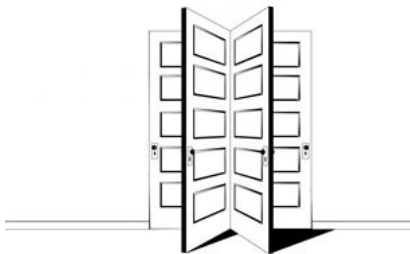
Rafaël Rozendaal www.biglongnow.com , 2006

En la exposición "Piece by Piece", la Galeria Dels Àngels presenta las primeras muestras individuales de dos jóvenes artistas, Miquel García (Barcelona, 1975) y Rafael Rozendaal. (Holanda, 1980).