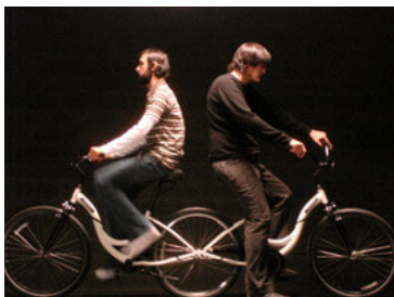
Miquel Garcia, Present by SUMO Still video –Bicicleta Modelo Present

Rafaël Rozendaal muestra sus animaciones Flash, Big long now y I am very very sorry , más una selección de dibujos. Para la exposición, ha realizado un mural sobre las paredes de la galería, reproduciendo el paisaje de su animación Vai Avanti . Rozendaal ( www.newrafael.com ), considera Internet como un lugar entre las ideas y los objetos, un espacio (no un medio) donde crear sus animaciones Web en las que a menudo involucra al espectador. Sus animaciones y dibujos han podido verse este mismo año en la Hayward Gallery (Londres). En 2006 expuso en el Benaki Museum (Atenas); Liquid Room (Tokio), GMVZ, (Ámsterdam) o la Galleria Pack (Milán), entre otros. En 2005 mostró sus trabajos en Sketch Gallery (London), en el LOOP Festival y en el Sonar (Barcelona) junto con otros artistas seguidores del movimiento NEEN. www.Neen.org . En 2004 formó parte del proyecto "Neentoday" en la MU Foundation (Holanda).