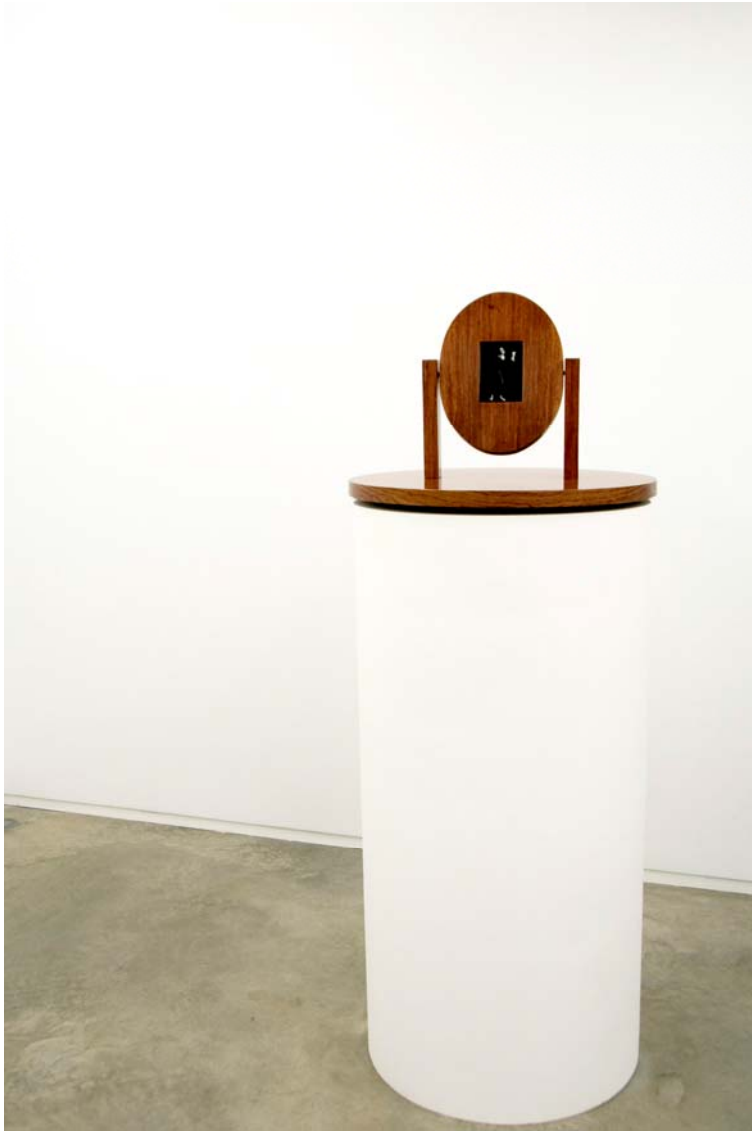
Vista general de la exposición