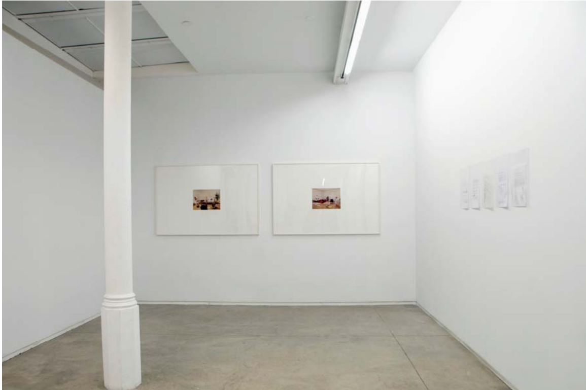
Vista general de la exposición