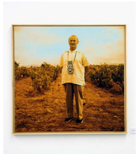
Joan Miró en el viñedo de Mas Miró, Montroig, Tarragona. 90 x 86 cm.

En este proyecto, Joan Fontcuberta toma contacto con la investigación de artistas como Miró, Picasso, Dalí y Tàpies en el dominio de las cámaras y los recursos fotográficos para mostrar que la lente, la luz y los materiales foto-sensibles no son sólo herramientas artísticas sino que contribuyen a generar nuevos ensayos plásticos.