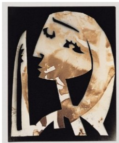
Cubierta de la publicación The artist and the Photographer , Editorial Actar, 2000

Collages elaborados con papeles de periódico en dónde la fotografía tiene un papel relevante