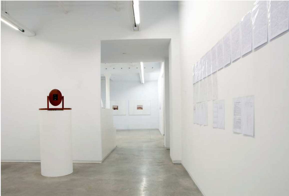
Vista general de la exposición