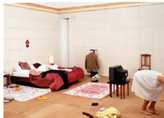
Detalle: S/T (Habitaciones exactas: Dormitorio) , 1989