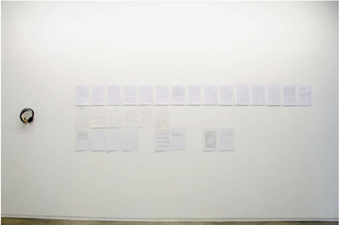
Vista general de la exposición