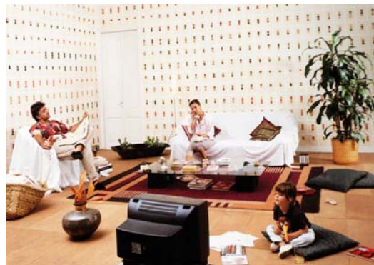
Detalle S/T (Habitaciones exactas: Salón) , 1989

S/T (Habitaciones exactas: Dormitorio) , 1989 Fotografía en color montada en metacrilato y enmarcada 100 x 150 cm.