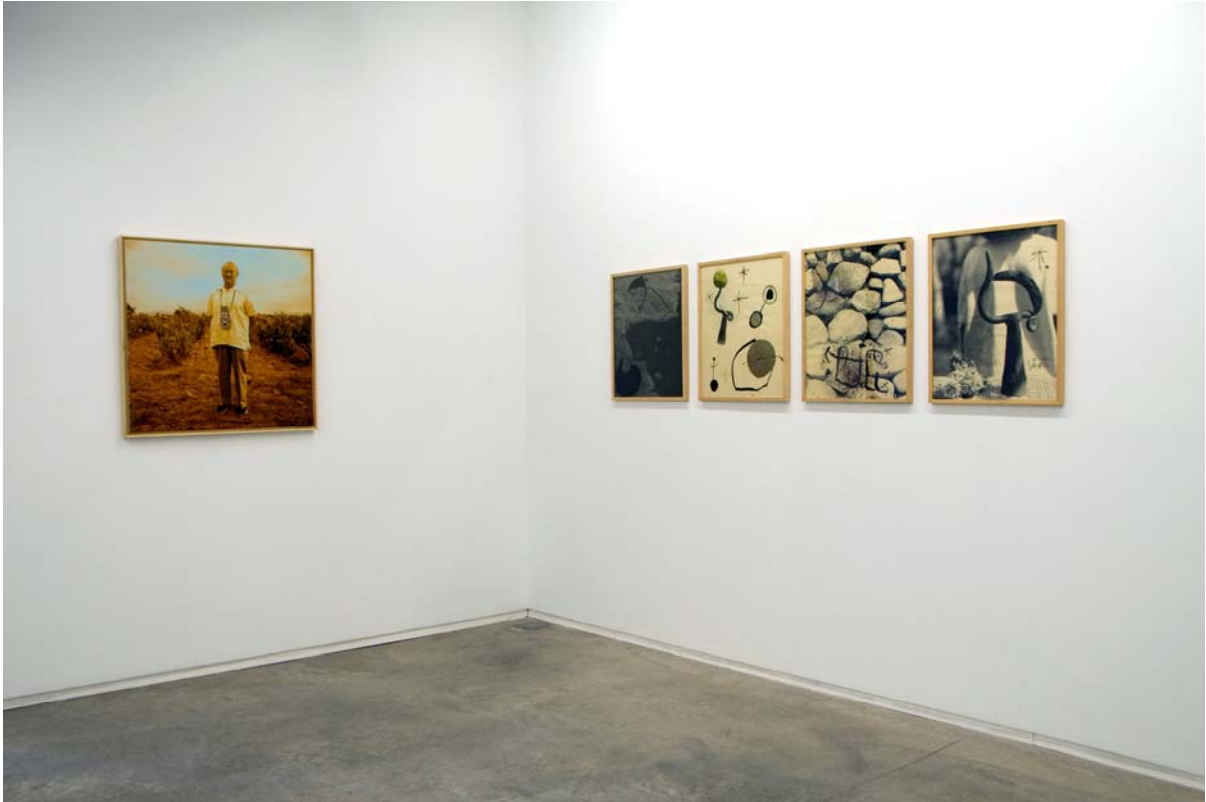
Vista general de la exposició