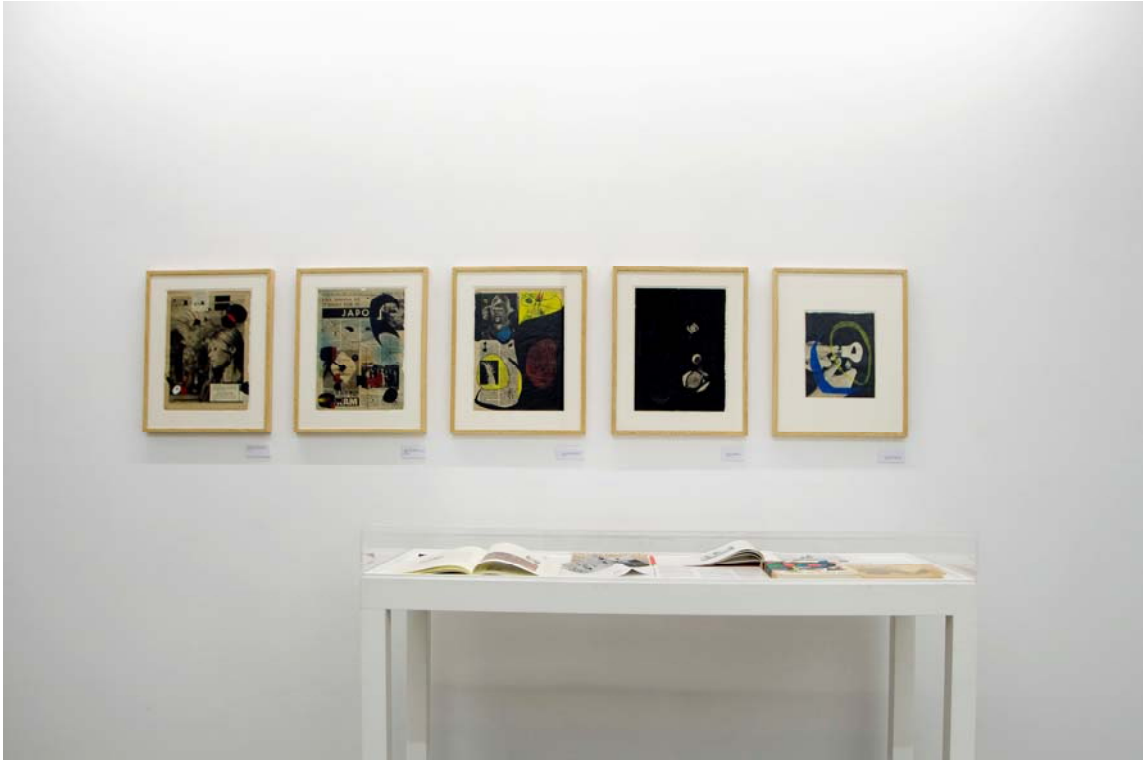
Vista general de la exposición